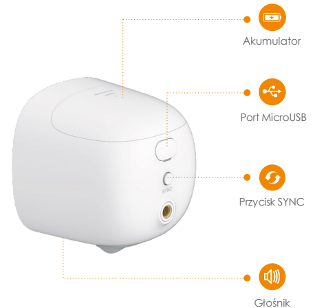
Widok z tyłu